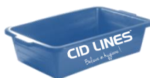
ONTSMETTINGSBAK CID LINES