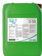
D 50 ontsmettingsmiddel