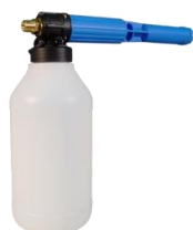
SCHUIMLANS HD 2 L